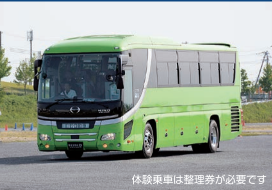
体験乗車は整理券が必要です

日野セレガに搭載されるドライバー異常時対応システムEDSSを第2会場内で実演します